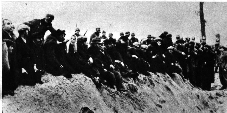
W drodze na egzekucję

Któregoś dnia, podczas sprzątania pokoju lagerführera, natrafiła na pudełko od butów wypełnione fotografiami. Wywarły na niej wstrząsające wrażenie. W ogromnym zdenerwowaniu kilka z nich zabrała z sobą i wyniosła do domu. Starannie je tam ukryła. Żadne ze zdjęć nie miało jednak podpisu. Nie uległo wątpliwości, że wykonał je ktoś, kto uczestniczył w zbrodniach dokonywanych w okupowanym kraju.